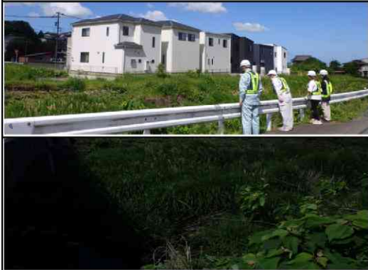
⑤貴船一丁目 ちびっこ運動広場横